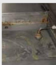
Рестораны шарагч тавцан