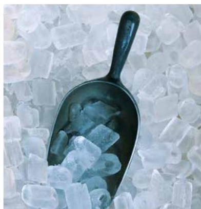
Мөсний машин илүү үр дүнтэй ажиллана.