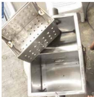
Тос баригчийн үнэр багасч, тос бөөгнөрөх нь багасна.