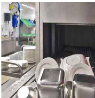
Аяга таваг угаагчийн өнгөр арилж, сав суулга толбогүй болно.