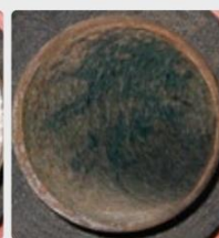
хоолой дахь био хальс